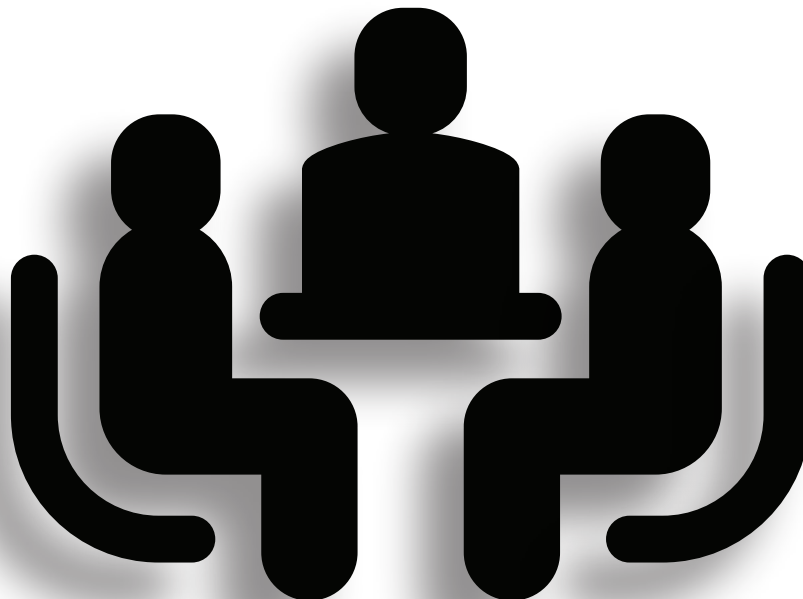
Table de Concertation Sainte-Thérèse

Table de Concertation 3ième âge Thérèse-De Blainville